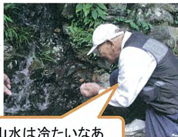
山水は冷たいなあ